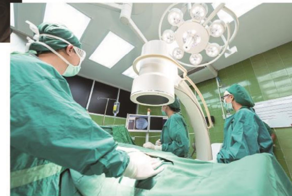
病院、クリニックなど