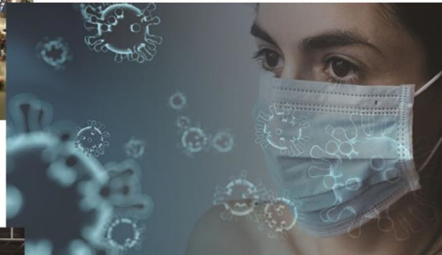
新型コロナウイルスの予防